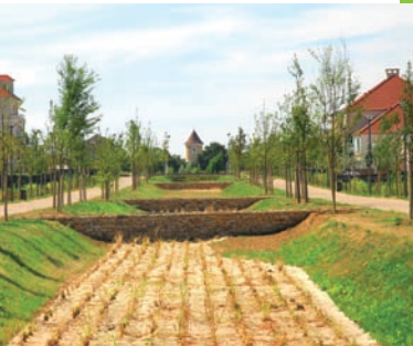
Promenade J. de Thou, Bussy-Saint-Georges