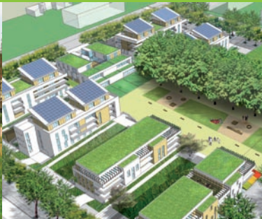
Ilot de l'écoquartier (Vue 3D)