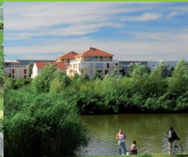
Parc Urbain - Bussy-Saint-Georges